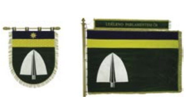
Obecní symboly - znak a prapor byly vysvěceny společně s kaplí

leží v severní části Moravského krasu. Osídlení je prastaré, odhaduje se v rozmezí 10. až první poloviny 13. století. První písemná zmínka je v Zemských deskách cúdy olomoucké z roku 1374. Při prvním soupisu domů v roce 1763 bylo v obci 18 domů se 176 obyvateli. Ve své historii užívala obec dvě pečete: první společnou s těsně sousedícím Sloupem, samostatnou od roku 1789. Název obce pravdě-podobně vychází z osobního jména Suš. Další výklady názvu jsou sauš – šuš, což je včelí plást či otvor v plástu, případně v přeneseném významu souš, tj. suchý strom s dutinou, v němž se usídlily včely.